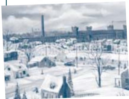
Montréal Cotton 1946

INFORMATION Service récréatif et communautaire 479, rue Hébert 450 370-4390