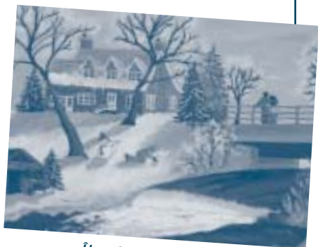
Île des Patriotes

Pour d'autres idées cadeaux, visitez le www.ville.valleyfield.qc.ca sous la rubrique « ACCUEIL / Idées cadeaux - Souvenirs ».