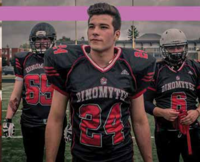
Premières images de la vidéo promotionnelle