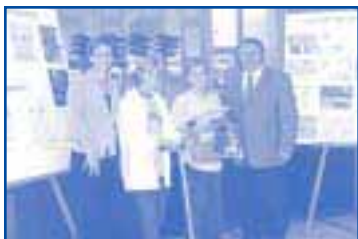
Gagnants du concours de dessins

Le Service des communications de la Ville de Salaberry-de-Valleyfield a instauré des ateliers de sensibilisation à l'économie d'eau potable auprès des jeunes de 5 e année (11 classes ont été visitées, soit 7 écoles primaires) et ont participé au concours de dessins. De ces jeunes, 15 ont voulu faire partie de la Police des eaux (enseigner à leur entourage quelques trucs pour économiser l'eau potable). Un franc succès !