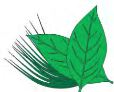
HERBE, GAZON ET FEUILLES