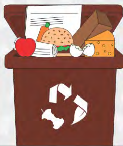
Séparer les couches de matières humides et sèches avec du papier journal