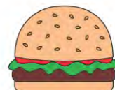
ALIMENTS PÉRIMÉS SANS EMBALLAGE