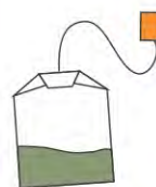
FILTRES À CAFÉ ET CAFÉ MOULU, SACHETS DE THÉ ET DE TISANE