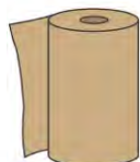
PAPIER ESSUIE-MAINS ET SERVIETTES DE TABLE