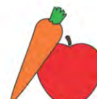
RÉSIDUS DE FRUITS ET LÉGUMES