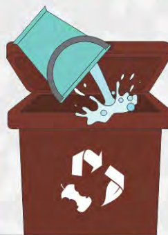
Lorsque le bac est vidé, le rincer avec un seau d'eau et du détergent doux ou avec du vinaigre blanc et de l'eau