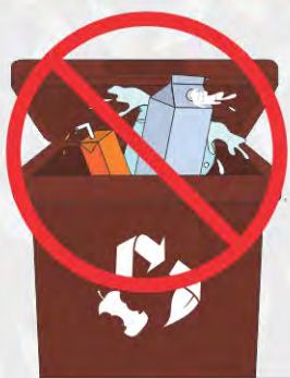
Éviter de mettre des liquides (lait, jus, soupe, etc.)