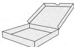
PAPIERS ET CARTONS SOUILLÉS PAR DES MATIÈRES ALIMENTAIRES